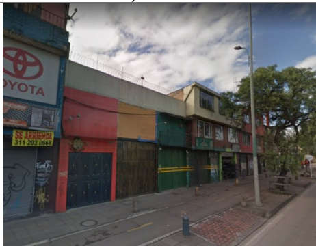
Foto 3. Vista panorámica del predio a donde va a ser trasladado el elemento de PEV, en la Av. Carrera 30 No. 66-52 (dirección catastral) orientación Sur-Norte