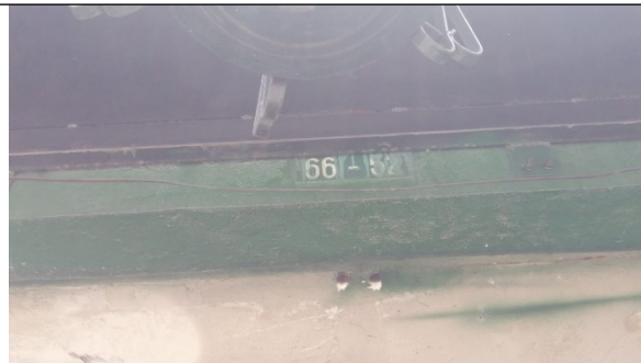
Foto 4. Nomenclatura del predio en la Av. Carrera 30 No. 66-52 – sitio del traslado.