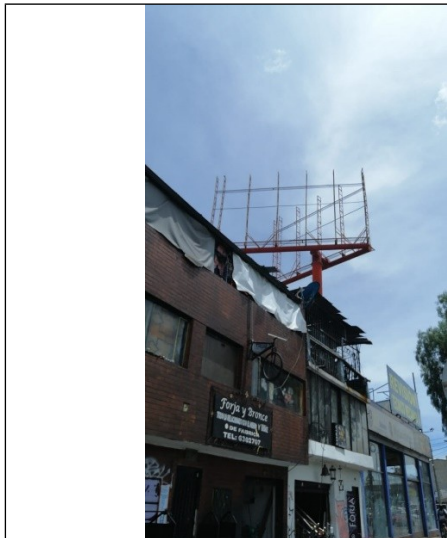
Foto 1. Vista panorámica del predio y de la valla donde se evidencia que los paneles se encuentran desmontados, ubicada en la Av. Carrera 30 No. 66-08 (dirección catastral) orientación Norte-Sur