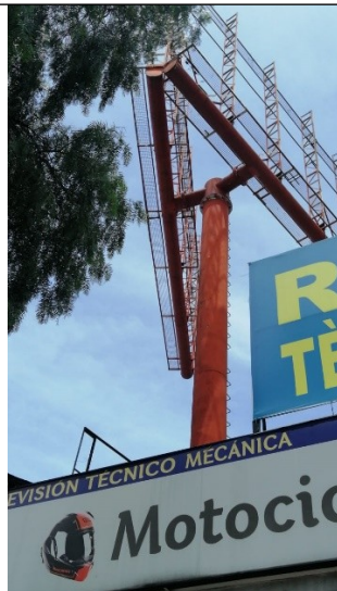
Foto 2. Detalle del mástil, de la estructura de la valla y de los paneles desmontados, ubicada en la Av. Carrera 30 No. 66-08 (dirección catastral) orientación Norte-Sur .